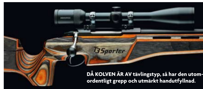
DÅ KOLVEN ÄR AV tävlingstyp, så har den utomordentligt grepp och utmärkt handutfyllnad.

STÄLLBAR BAKKAPPA på den här vapentypen är en stor fördel. I liggande är den helt uppskjutna bakkappan perfekt, och vid andra skjutställningar kan det finnas andra höjder som passar bättre.