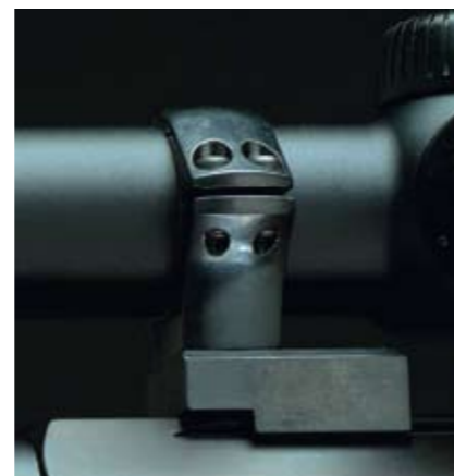
TILL BÅDE TIKKA OCH SAKO finns de utmärkta optilockfästena som har en plastring på insidan för att inte skada kikartuben.

av militära kikarfästen för primärt skarp- och prickskyttar och eftersom jag främst använder min privata T3 Varmint till långhållsskytte, så ville jag använda dessa fästen. Tack och lov har Tikka T3 samma laxspår ovanpå lådan som Sako TRG, så följaktligen passar mitt eget kikarfäste på T3. Inte helt konstigt egentligen eftersom de tillverkas av samma fabrik.