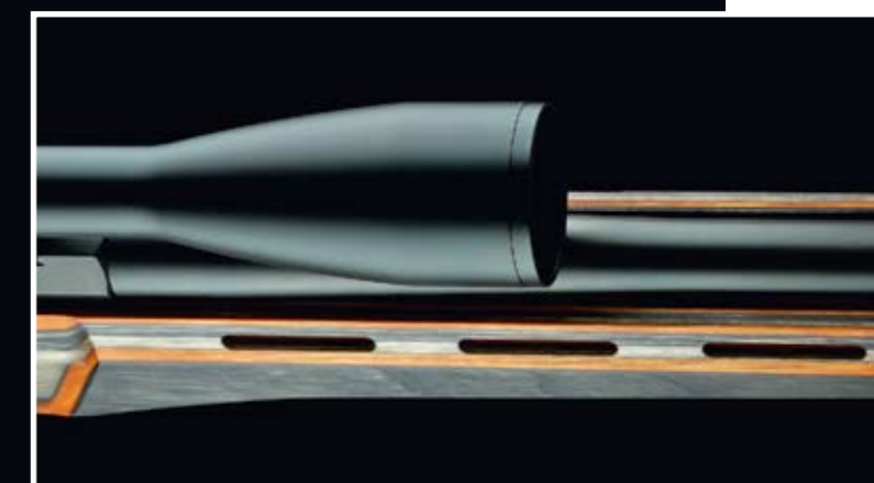
PIPAN ÄR REJÄLT FRILAGD, så här lär det aldrig uppstå några problem med att pipan ligger för nära stocken.