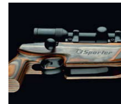
LIKSOM SLUSTYCKETS HYLSA ÄR även underbeslaget tillverkat av plast.